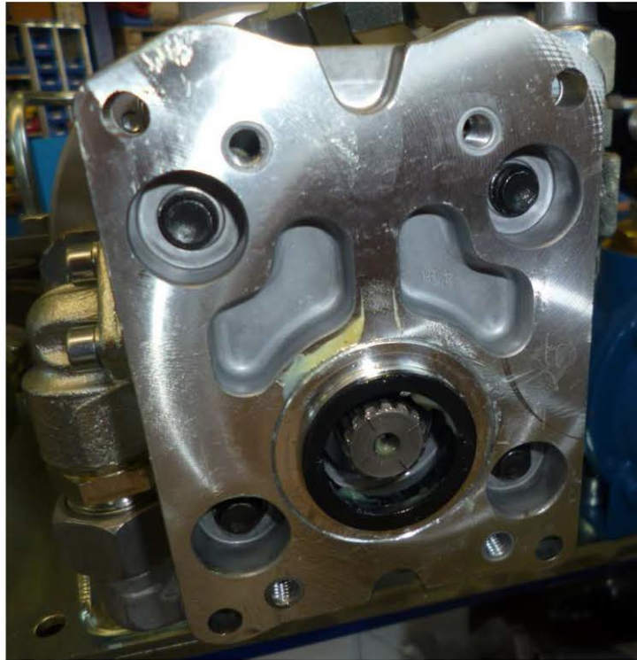
Foto špatně nasazeného těsnění mezi sekce.

Foto správně nasazeného těsnění mezi sekce.